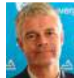
Laurent WAUQUIEZ Président de la Région Auvergne-Rhône-Alpes